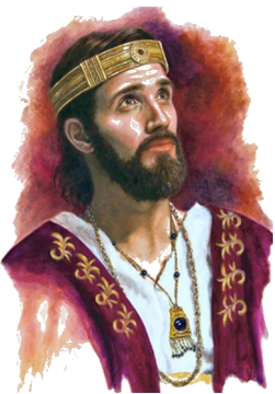
Foto: Regele Iosia

Scopul cărților I și II Cronici este de a arăta că în ciuda numeroaselor dezastre ce au culminat cu căderea regatelor lui Israel și Iuda, Dumnezeu și-a ținut promisiunile față de poporul ales. Pe de altă parte, cei abia întorși în patrie erau încredințați că Dumnezeu îi va ocroti așa cum a făcut-o și în trecut, dacă vor restabili cultul autentic.