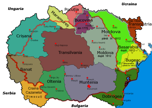
Regiuni istorice în care se vorbește limba română