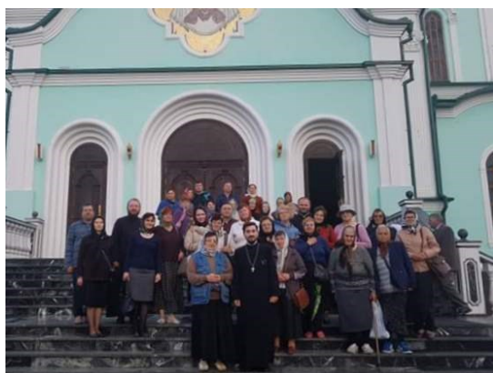
La Mănăstirea Bănceni

Prăznuirea acestei icoane se face în 28 martie