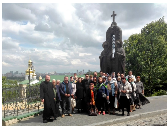
La Lavra Pecerska (Kiev)