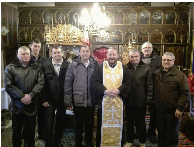
Membrii Consiliului parohial