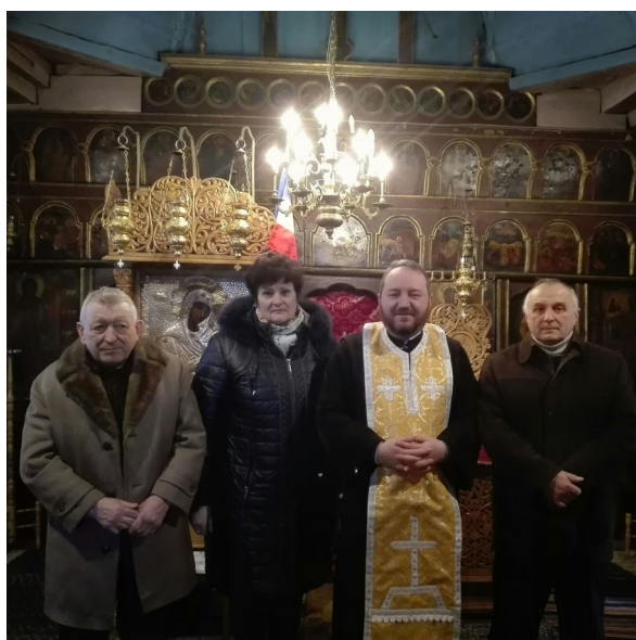
Membrii Biroului Comitetului parohial